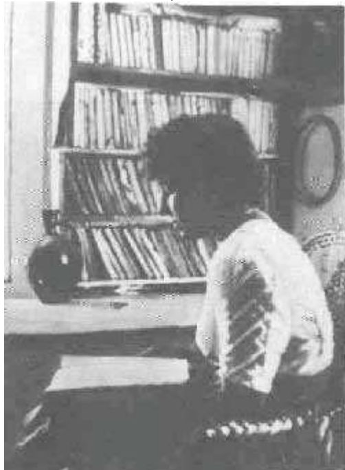
стране. Коктебель, 1911

◆ Огромное влияние на Марину оказала ее мать, Мария Мейн, мечтавшая, что дочь пойдет по ее стопам и станет пианисткой. Однажды Александровна записала в дневнике следующие строчки: "Четырехлетняя моя Муся ходит вокруг меня и все складывает слова в рифмы, - может быть, будет поэт?" . Как показало время, пророчество сбылось. Мать воспитывала дочерей достаточно строго, образование они получили превосходное, но скоро Мария Цветаева заболела чахоткой и семья была вынуждена уехать за границу. Несмотря на все усилия, Мария в 1906 году умерла и заботы о Марине, ее младшей сестре Анастасии и об их сводном брате по отцу Андрее легли на плечи отца, который, впрочем, был занят на службе и не мог посвящать все свое время детям. Возможно, именно поэтому девочки выросли очень самостоятельными, достаточно рано начали интересоваться не только отношениями с противоположным полом, но и политической обстановкой в