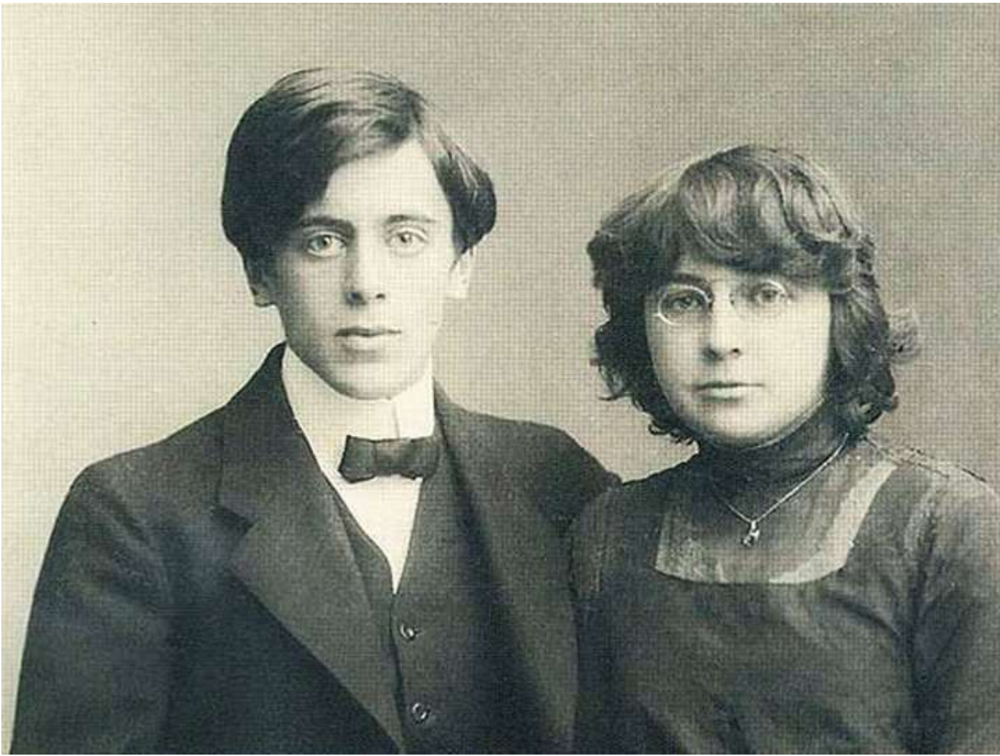
Марина Цветаева и Сергей Эфрон

◆ В один из вечеров ноября 1920 года Цветаева присутствовала на спектакле в Камерном театре. Спектакль неожиданно прервали сообщением о том, что Гражданская война закончена и белогвардейцы разгромлены. Под торжественное звучание "Интернационала" Цветаева лихорадочно перебирала в голове мысли о муже: жив, убит или ранен и уже на пути домой? Через нескольких месяцев тягостного ожидания Цветаева решила передать письмо за границу на случай, если Сергей Эфрон вдруг объявится. "Если Вы живы - я спасена. Мне страшно Вам писать, я так давно живу в тупом задеревенелом ужасе, не смея надеяться, что живы, - и лбом - руками - грудью отталкиваю то, другое. - Не смею. - Все мои мысли о Вас... Если Богу нужно от меня покорности - есть, смирения - есть, - перед всем и каждым! - но, отнимая Вас у меня, он бы отнял жизнь" .