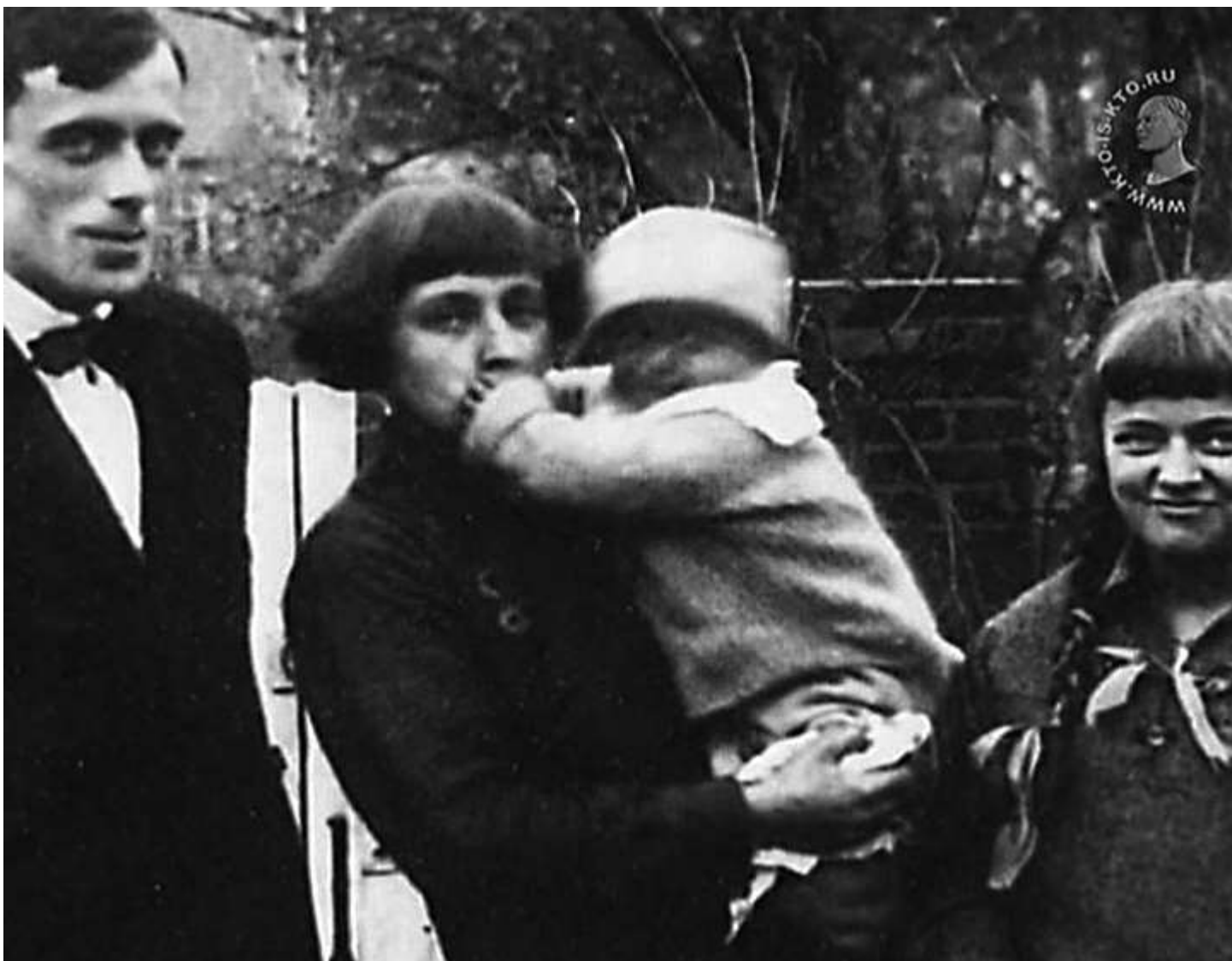
Сергей Эфрон, Марина Цветаева с Георгием (Муром) и Ариадна Эфрон. Вишеноры (Чехия), 1925 год