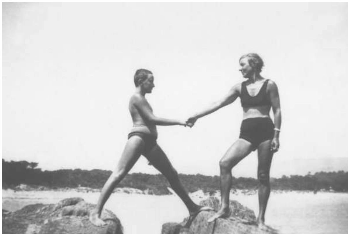
Марина Цветаева с сыном Георгием, Фавьер, 1935

♦ Однако время не стояло на месте. В лице дочери Али Марина Цветаева также не могла найти единомышленника. Повзрослевшая Аля разделяла взгляды отца. Даже маленький сын Георгий (дома его звали Мур), чувствуя настроение взрослых, просил маму переехать в Россию. Теперь Цветаева верила только своему таланту. Она жила надеждой, что со временем сын станет на ее сторону и, более того, займет ее место. Но никто из детей не унаследовал ее дарования. Видимо, такова была судьба Марины Цветаевой.